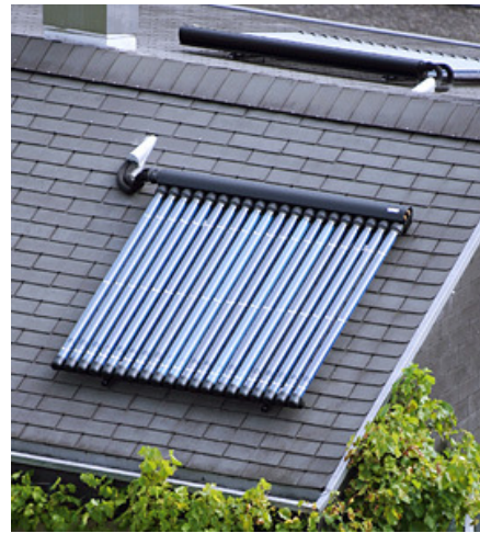
Röhrenkollektoren; Foto: Elco