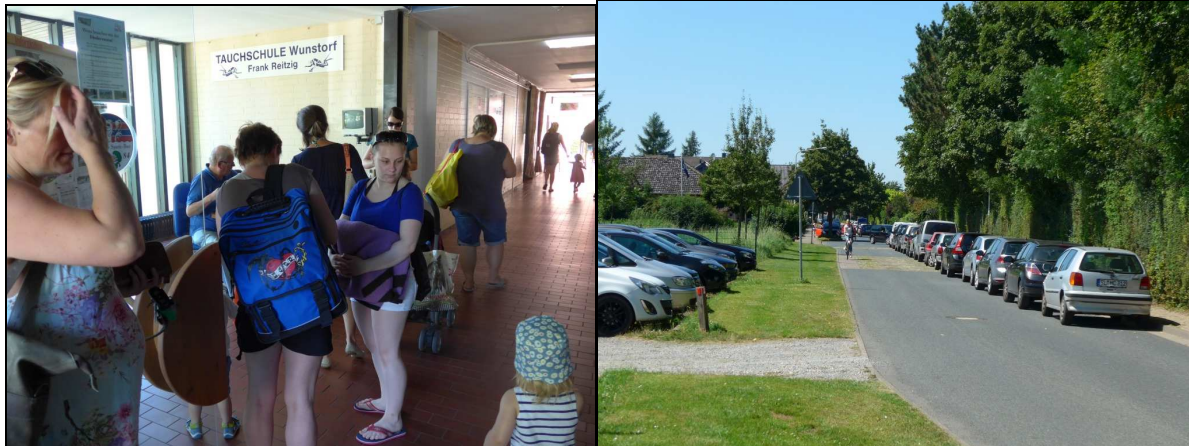
(Bild links: Ansturm an der Kasse; Bild rechts: Parken bis hinein in die Rotdornstraße am Sportplatz)

In der vorletzten Juliwoche hatten wir richtig schönes Sommerwetter. Alle waren zufrieden und mit verstärktem Einsatz der Badeaufsichten – zeitweise waren 5 Aufsichten am Wasserrand aktiv – konnten wir den Ansturm bewältigen. Unser Dank gilt auch dem Kassenteam. Teilweise waren bereits 3 bis 4 ehrenamtliche Helfer ab 10:00h morgens im Einsatz, um nicht nur Tageskarten zu verkaufen, sondern auch den vielen neuen Gästen von außerhalb den Weg ins Bad zu erklären.