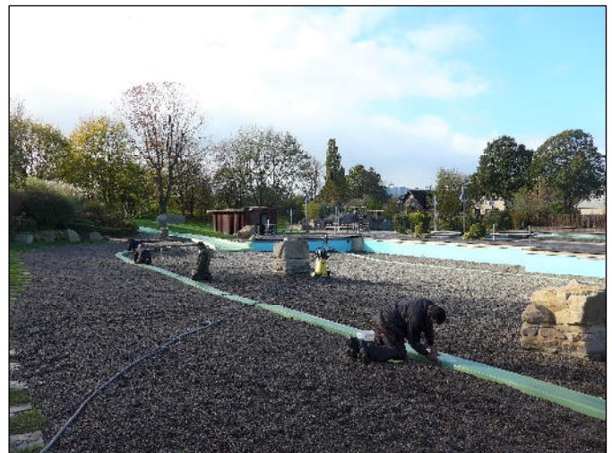
Reinigungsarbeiten im Nichtschwimmer